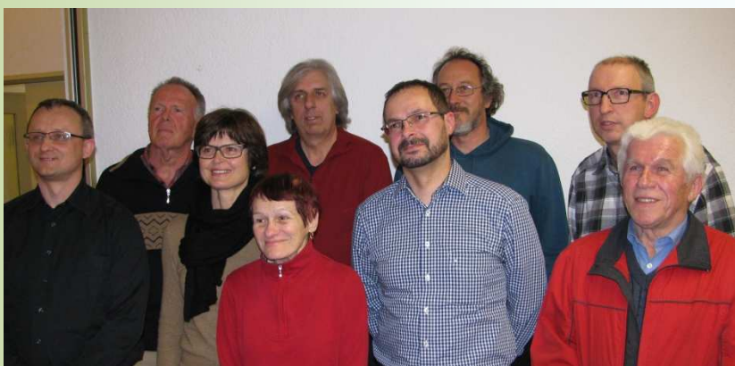
Der neue Vorstand